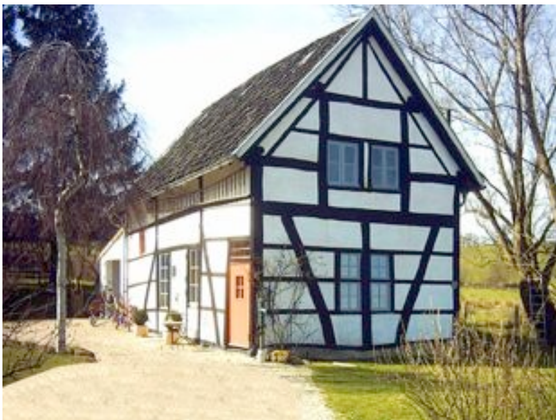
Foto 1 – Vakwerkhuis in Zuid-Limburg, Nederland.

Pure, ruwe, ongebakken aarde werd alleen in het zuiden, in de provincie Limburg, gebruikt voor de bouw van huizen, de zogenaamde vakwerkhuisen. Een eikenhouten skelet, wordt opgevuld met dunne gevlochten staken en vervolgens afgesmeerd met een vette klei. Soms wordt deze klei vermengd met stro. Om de leem voldoende waterafstotend te maken wordt deze periodiek geschilderd met een kalkverf. Het houten skelet blijft hierbij zichtbaar. Deze bouwwijze is jullie wel bekend, deze komt immers ook in andere landen voor. Mede omdat deze methode niet voldoet aan het huidige bouwbesluit van de Dutch Building Council, het heeft onvoldoende isolatiewaarde, worden op deze manier worden geen huizen meer gebouwd. Renovatie van de oude vakwerkhuisen vindt wel plaats door aan de binnenzijde isolatieplaten aan te brengen.