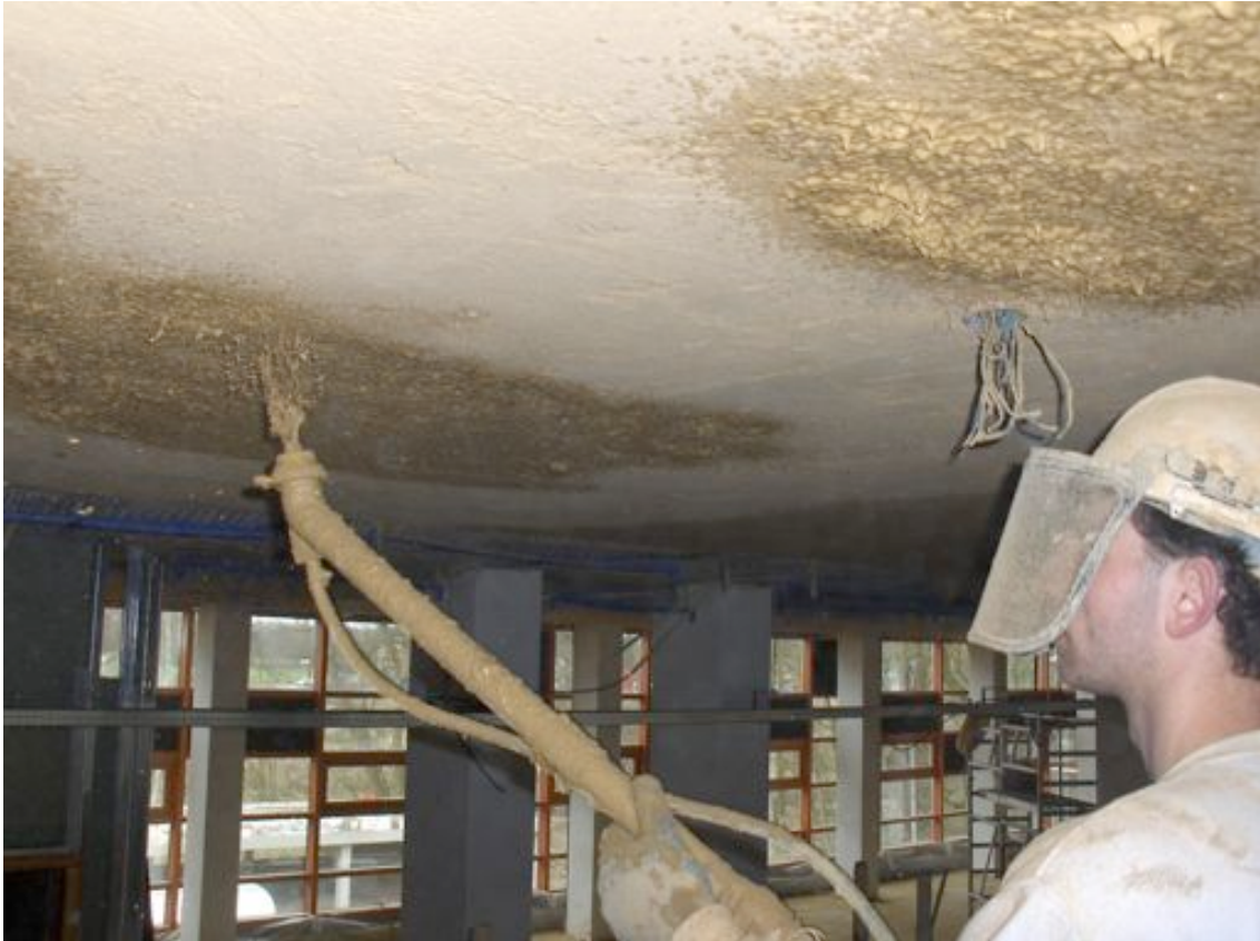
Foto 2 – Spuiten klimaatmatten WNF Zeist, Nederland.

Het groeiend milieubewustzijn in Nederland en de klimaatveranderingen heeft ertoe bijgedragen dat duurzaam bouwen steeds meer aandacht krijgt. Echter op dit moment is duurzaam bouwen nog voor een groot deel synoniem aan CO 2 -neutraal, energiezuinig en hoge isolatiewaarden. In Nederland is men momenteel vergevorderd met het opstellen van een Nationale Database voor bouwmaterialen. In deze database zijn milieugegevens van de meeste bouwmaterialen opgenomen. Inmiddels zijn enkele computerprogramma's ontwikkeld die op basis van deze gegevens de totale milieubelasting van een gebouw in kaart brengen. Steeds vaker wordt zo'n 'tool' gebruikt om tot het minst milieubelastende ontwerp te komen.