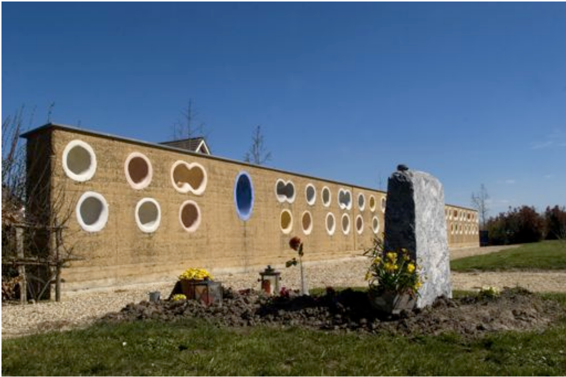
Foto 3 – Urnenmuur begraafplaats Spijk, Nederland